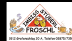
3912 Grafenschlag 20 A, Telefon 02875/7356